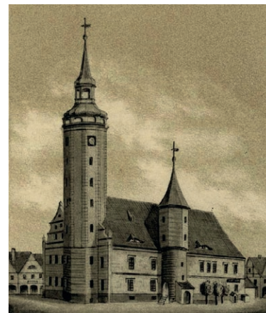
Ilustracja 3 – Ratusz po 1552 r. [9]

Miasta i Gminy Sulechów oraz Gazeta Lubuska z tekstem o remoncie zamku [8].