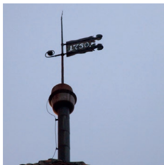
Ilustracja 2 - Kula zamku z chorągiewką i gwiazdką w listopadzie 2011 r.