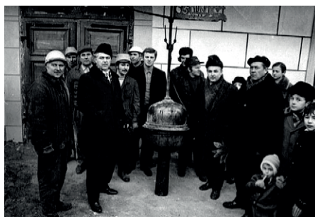
Ilustracja 7 – Zdemontowany szpic ratuszowej wieży (archiwum Urzędu Miasta w Sulechowie, 1974 r.)

Prace remontowe wieży ratuszowej prowadzono bardzo długo. I tak 4 lutego 1974 r. pracownicy poznańskiego oddziału Pracowni Konserwacji Zabytków zainstalowali na wieży trzy XIX-wieczne tarcze zegarowe. Zaplanowano prace konserwatorskie słonecznego zegara znajdującego się na południowej jej ścianie.