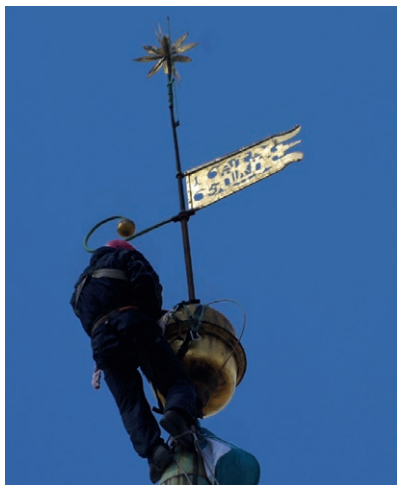
Ilustracja 4 – Kula i chorągiewka wieńcząca szpic ratuszowej wieży

Zapewne wówczas wzniesiono nad wieżą zachodnią hełm o późnorenesansowych formach [10, s. 19].