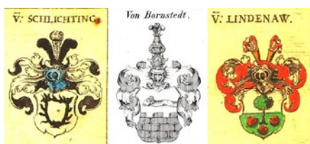
Rys. 6 Od lewej: herb rodu Schlichting (Sibm. I. 64), Bornstedt, Lindenau (Sibm. I. 159)