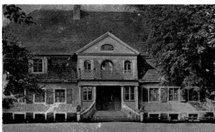
Rys. 5 Dwór w Łochowie, pocz. XX w.