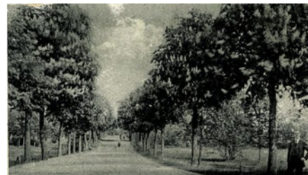
Rys. 4 Droga z Łochowa do Sulechowa, pocz. XX w.

W Topograficzno-statystycznym przeglądzie okręgu administracyjnego Frankfurtu nad Odrą z 1844 r. podano, że we wsi znajdowały się 22 budynki mieszkalne, w których mieszkało 148 osób (według spisu z 1840 r.), a wieś należała do ewangelickiej parafii w Kijach [6, s. 244].