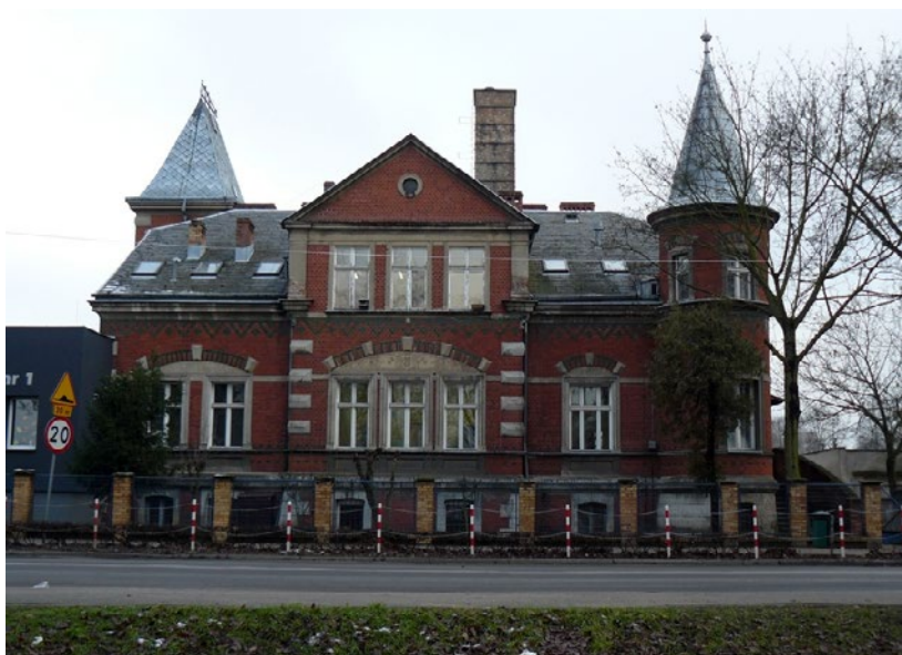
Budynek B Szkoły Podstawowej nr 1 w Sulechowie

DOFINANSOWANO ZE ŚRODKÓW RZĄDOWEGO FUNDUSZU INWESTYCJI LOKALNYCH