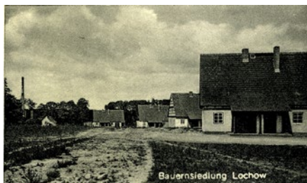
Rys. 2 Osada rolników w Łochowie, pocz. XX w.