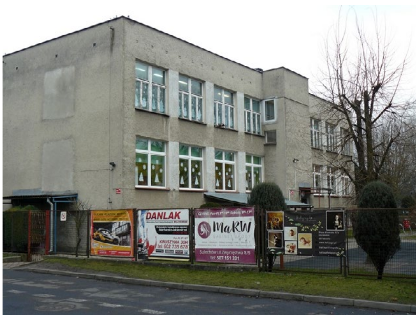
Przedszkole nr 7 w Sulechowie

■ W ramach wsparcia z Rządowego Funduszu Inwestycji Lokalnych (RFIL) gmina Sulechów otrzymała dofinansowanie do realizacji dwóch inwestycji. Pierwszą jest realizowana obecnie przez gminę Termomodernizacja i remont za- bytkowego budynku B Szkoły Podstawowej nr 1 w Sulechowie . Wnioskowany szacunkowy koszt całkowity inwestycji wynosi 1 759 908,35 zł, kwota dofinansowania z RFIL to 1 231 935,85 zł (70%), a wkład własny – 527 972,50 zł. Przewidywaną realizację zadania zaplanowano na okres od października 2020 do sierpnia 2021 . Prace budowlane obejmą remont dachu (w tym kominów), docieplenie ścian i stropu piwnic oraz poddasza, remont stolarki okiennej i drzwiowej (renowacja), czyszczenie elewacji i elementów architektonicznych, wykonanie instalacji wentylacyjnej (rekupe- racja), roboty elektryczne (instalacja do zasilania urządzeń), wymiana instalacji c.o. i ciepłej wody użytkowej oraz montaż podjazdu dla osób niepeł- nosprawnych.