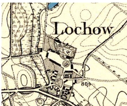
Rys. 1 Dobra szlachecka w Kijach na fragmencie mapy z 1899 r.

(strona internetowa Zamki, pałace, dworki..., https://zamkilubuskie.pl/kijekay/ z dnia 6.12.2020)