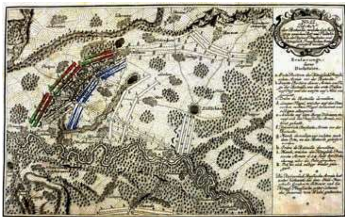
Ryc. 4 – Plan sytuacyjny bitwy pod Kijami [9]