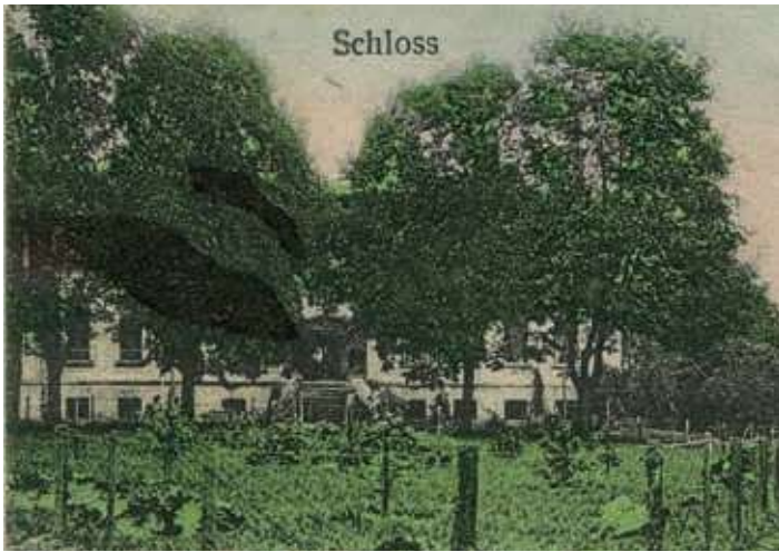
Ryc. 1 – Nieistniejący dzisiaj dwór w majątku – Kije, 1908 r.