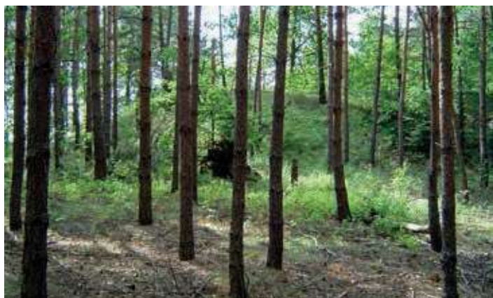
Ryc. 5 – Pozostałości grodziska w Kijach, 2004 r.