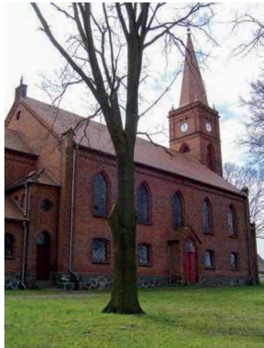
Ryc. 3 – Kościół w Kijach, 2007 r.