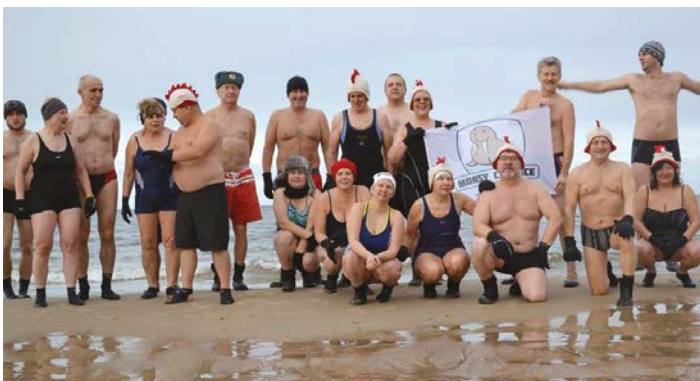
Zdarza się, że tyłu nas jest (listopad 2016)

rozgrzane ćwiczeniami i bieganiem przed kąpielą. Pokazują w ten sposób, że zimno im nie straszne a niektórzy (tych również co raz więcej) pływają w rzece jak ryby i nurkują jak morsy. Ta sympatyczna grupa już liczy kilkanaście osób i z każdym spotkaniem (z każdą kąpielą) się zwiększa. Najpierw nieśmiało przy-