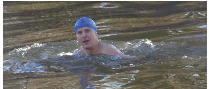
Starszy również pływa i resetuje się

Dziś dzięki mediom społecznościowym i znajomościom z różnymi sportowcami grupa zaczęła się powiększać sukcesywnie a ich poczynania są co raz śmielsze. Do tego należy dołożyć co raz dalsze wyjazdy na wspólne morsowanie z innymi grupami. Dzięki życzliwości wypożyczalni RENT z Zielonej Góry udało im się wyjechać do Międzyzdrojów na wspólną kąpiel z morsami