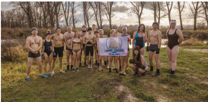
Międzyzdroje, 6 stycznia 2017

i na brzegu Obrzycy czasami słychać gwar i muzykę. Mimo że mamy zimę (i jest zimno) nad Obrzycą gwar nie milknie. Dzieje się tak za sprawą sporej grupy osób (również z Górzynkowa), która to miejsce obrała sobie na niedzielne spotkania. Można by rzec nawet na piknikowanie gdyby nie to, że to nie pora na piknik. Im to nie przeszkadza i regularnie co niedzielę o 13.30 spotykają się gromadnie i z uśmiechem na twarzach ćwiczą, biegają i morsują (czyli zażywają kąpeli). Hartują tym swoje organizmy