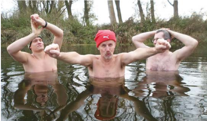
Początek sezonu 2016/2017

Górzynkowo w ostatnich miesiącach jawiło nam się jako miejsce wielu ciekawych wydarzeń kulturalnych i nie tylko. Wiele z nich odbywało się w pozyskanym od Powiatu budynku przekształconym na salę wiejską dzięki aktywności Rady Sołeckiej i Pani sołtys. To jednak nie jedyne miejsce spotkań w Górzynkowie bo