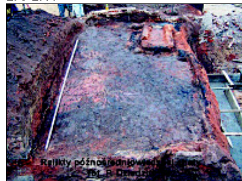
Relikty późnośredniowiecznej