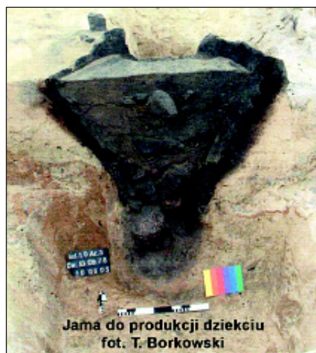
Jama do produkcji dziegiu