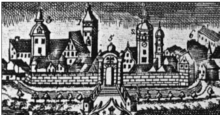
Foto 2. Sulechów. Brama Krośnieńska. Fragment ilustracji pokazujący miasto ok. 1730 r. zamieszczonej przez I. Pereyt - Gierasimczuk w "Czas architekturą zapisany. Zabytki województwa zielonogórskiego", Zielona Góra 1998, s. 193.

Czwarta brama miejska powstała ok. 1708 r., o której wspomina tylko Wilcken (s. 13) nazywając ją Bramą Królewską (das Königs Thor). Prowadziła ona na teren nazywany wówczas "ogrodami zamkowymi". Wówczas osiedle powstałe za tą bramą składało się z 40 domów, słodowni i browaru. Przedmieście to ulokowano w miejscu dawnego wielkiego sadu owocowego należącego do Urzędu Królewskiego, przekazanego miastu rezolucją królewską właśnie w 1708