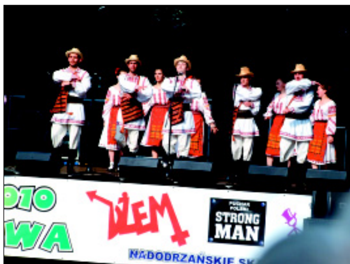
Mołdawski zespół Loziore