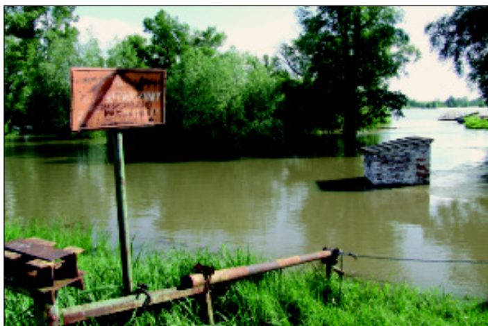
25 maja 2010 Brody

Burmistrz Ignacy Odważny oraz Sztab Kryzysowy