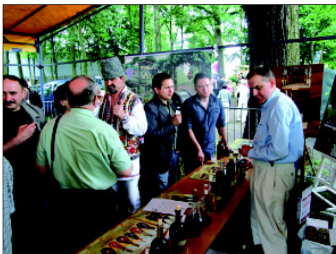
Wina z mołdawskiego stoiska