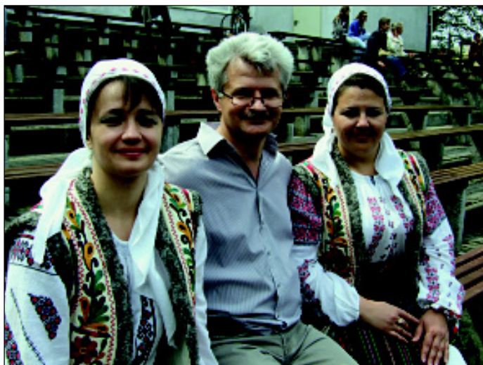
Mołdawianki przed występem

W ostatnim dniu swojej (29. maja br.) wizyty goście mieli okazję zobaczyć przebieg święta naszego miasta - Dni S u l e c h o w a . W dniu tym zespół „Loziore”, przebrany w stroje ludowe, dwukrotnie wystąpił na scenie amfiteatru. Mieszkańcy Sulechowa wysłuchali i zobaczyli szereg pieśni i tańców okręgu Criuleni. Szczególnym powodze-