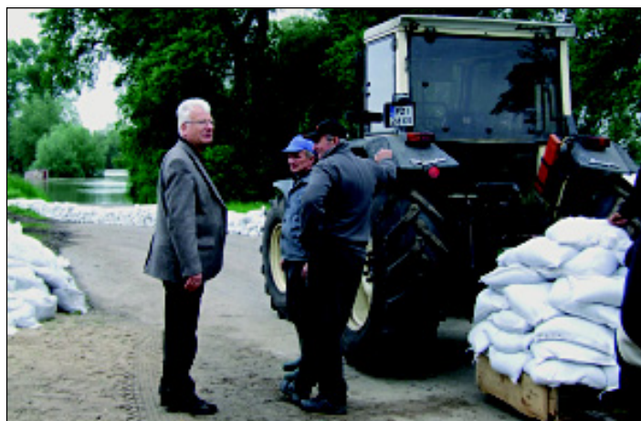
Burmistrz w Pomorsku