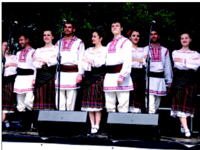
Występ podczas Dni Sulechowa

stwa Zielonogórskiego. Podczas spotkania przedstawiciele władz wymienili poglądy na temat problemów zarządzania partnerskimi gminami i powiatami. Rozmawiano również o powodzi jaka nawiedziła nasz kraj i sposobach jej zwalczania.