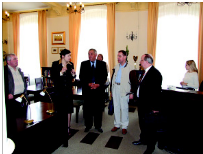
Wizyta w sulechowskiej uczelni