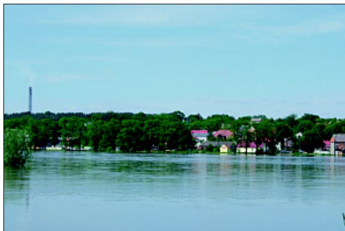
26 maja 2010 Cigacice