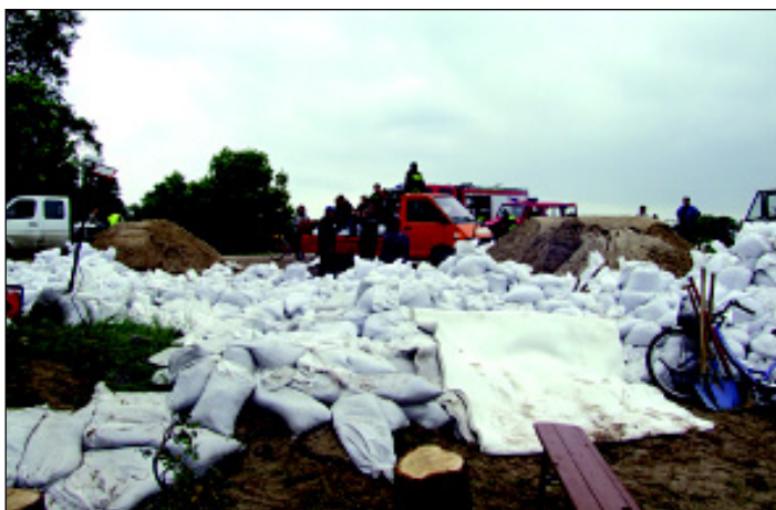
27 maj 2010 Pomorsko