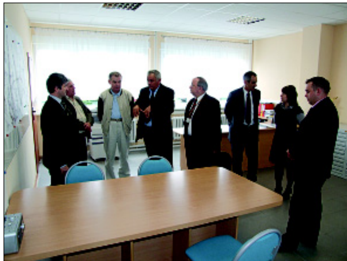
Wizyta w SuPeKom-ie

spół ludowy „Loziore” zwiedzał zielonogórski gród. W tym samym dniu w godzinach popołudniowych tancerze wystąpili w Szkole Podstawowej w Cigacicach.