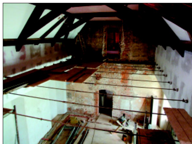
Widok na salę balową z balkonu