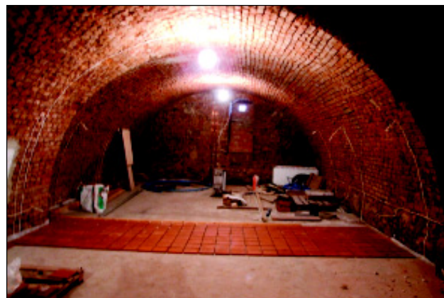
Piwnica pod skrzydłem zamku

Projekt współfinansowany przez Unię Europejską ze środków Europejskiego Funduszu Rozwoju Regionalnego w ramach Lubuskiego regionalnego Programu Operacyjnego na lata 2007 - 2013.