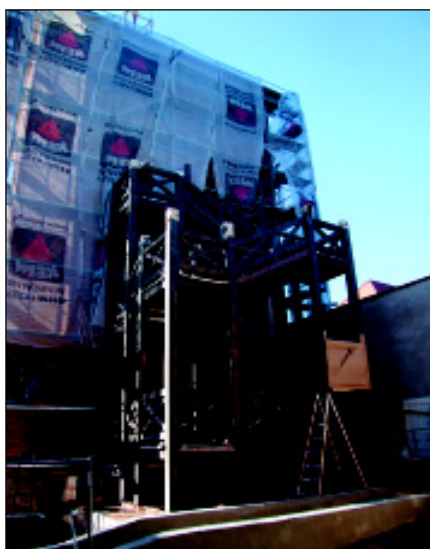
Zewnętrznej klatki schodowej przy wieży brakuje tylko zadaszenia.

Remont sulechowskiego zamku minął półmetek. Pragniemy przedstawić aktualne fotografie znaczących miejsc tego odnawianego obiektu.