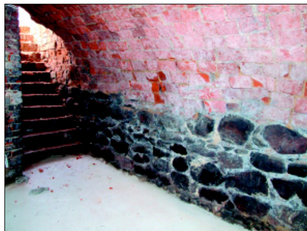
Pomieszczenie pod wieżą