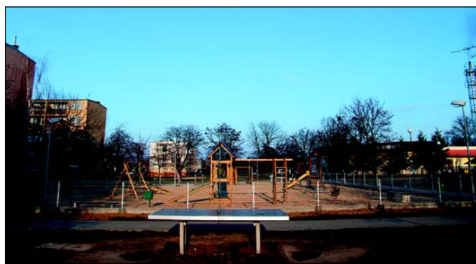
Ogrodzony plac zabaw na os. Nadodrzańskim w głębi odnowiony dwupiętrowy blok nr 4.

Kiedy na początku lat 90. państwo zaprzestało wspierać spółdzielnie mieszkaniowe tanimi kredytami budowlanymi, sulechowska SM zrezygnowała z budowy mieszkań. Zaprzestano też naboru nowych