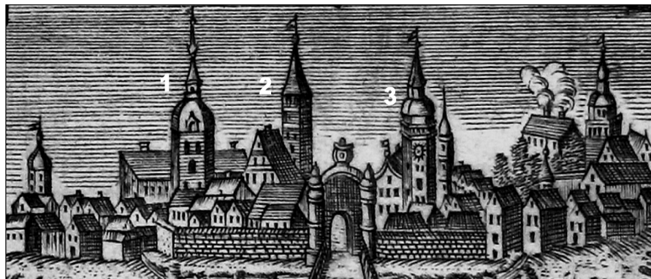
Panorama miasta z 1780 r. pod numerem: 1 - zamek, 2 - kościół farny, 3 - ratusz