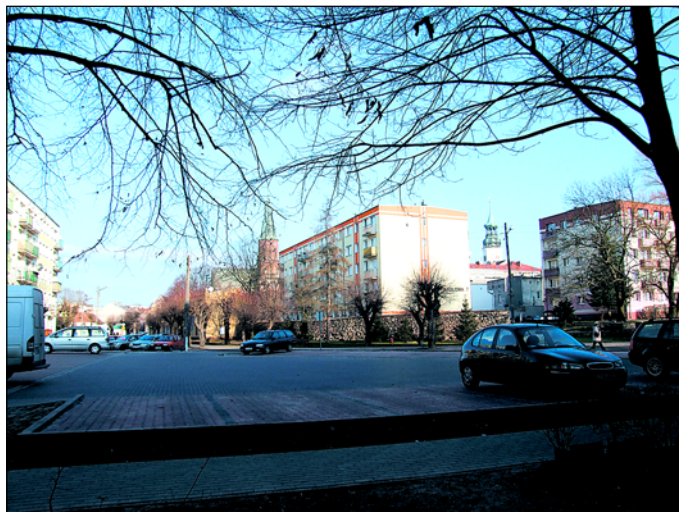
Parking na 41 miejsc przy ul. Okrężnej oraz ocieplony blok - widoczny jego fragment po lewej str. foto. a po prawej dwa bloki przy ul Handlowej.

członków, bowiem nie było chętnych do korzystania z kredytów budowlanych na komercyjnych zasadach. Banki w swoich ofertach nie posiadały kredytów i zachęt wspierających budownictwo wielorodzinnych bloków spółdzielczych. Ostatnie bloki jakie SM wybudowała i zasiedliła 17 lat temu, znajdują się przy ulicach Wiśniowej i Klonowej