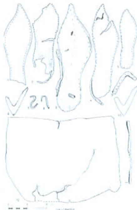
fragmenty obuwia znalezione na terenie warsztatu szewskiego

Wśród zabytków skórzanych udało się wydzielić części spodu (podeszwy) o różnym kroju, z dookólnymi