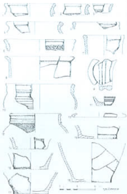
ceramika stalowszarska znaleziona na terenie warsztatu szewskiego

XIV - wiecznej pokrywki oraz ucha, które mogą stanowić ułamki dzbanów. Na uwagę zasługują dwa fragmenty brzegów mis o niemożliwym do ustalenia kształcie. Ich chronologię można określić na drugą połowę XIII-