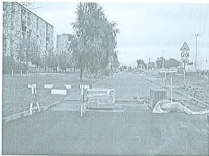
ul. Południowa – remont nawierzchni i budowa chodnika.