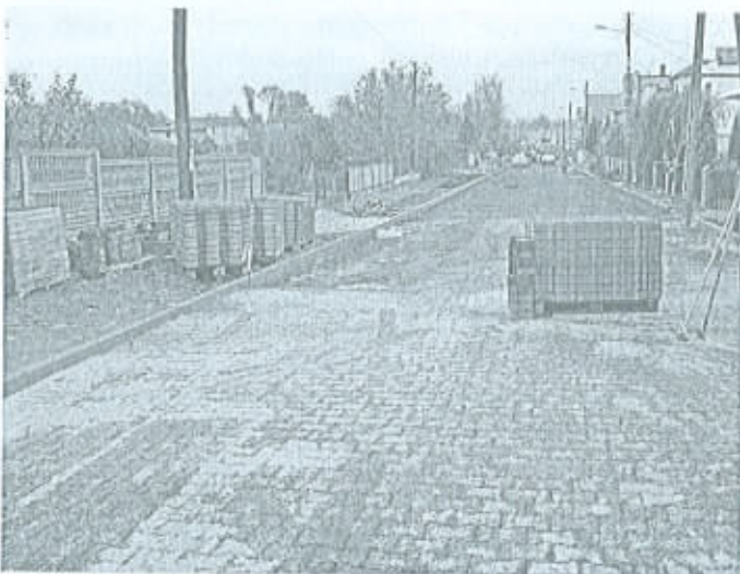
ul. Prusa – remont nawierzchni drogi.