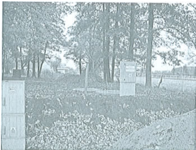
Kanalizacja Oblotne i Krężoły. Inwestycje zakończone.

Inwestycja zamówiona przez Gminę. Termin realizacji zamówienia do 20.12.2005 roku.