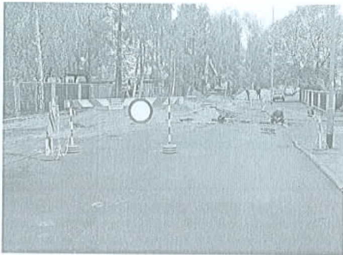
ul. Słoneczna – budowa kanalizacji. Inwestycja SuPeKom.