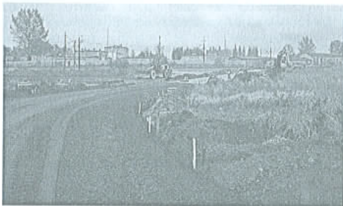
ul. Rozwojowa – budowa drogi.

Inwestycja zamówiona przez Gminę. Termin realizacji zamówienia do 20.12.2005 roku.