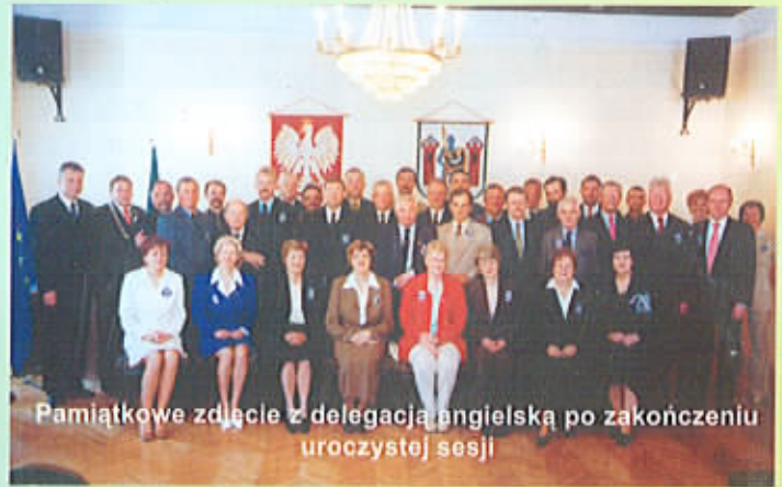
Pamiątkowe zdjęcie z delegacją angielską po zakończeniu uroczystej sesji

2 maja delegacja z Rushmoor zwiedziła Muzeum Martyrologii Jeńców Alianckich w Zaganiu. Członkowie komitetu do spraw współpracy miast bliźniaczych odwiedzili Łęgowo, gdzie obejrzeli przedstawienie w języku angielskim w wykonaniu uczniów z sulechowskiej Szkoły Podstawowej nr 1 oraz Szkoły Podstawowej w Bukowie, zwiedzili też znajdującą się nieopodal farmę strusią.