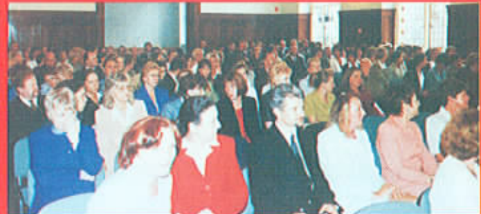
Absolwenci studiów zaocznych i dziennych.