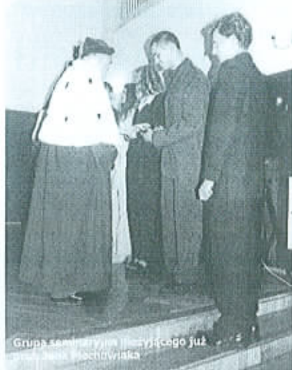
Grupa seminarystów historycznego już w Sulechowie