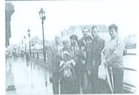
Krwiodawcy z Rockwool i Elektrowni Turów w Bogatyni na deszczowym spacerze po Gdańskiej Starówce.)