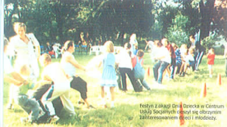
Festyn z okazji Dnia Dziecka w Centrum Usług Socjalnych cieszył się olbrzymim zainteresowaniem dzieci i młodzieży.

- Jako prezes sulechowskiego Klubu Abstynentów uczestniczyłam w zlocie klubów