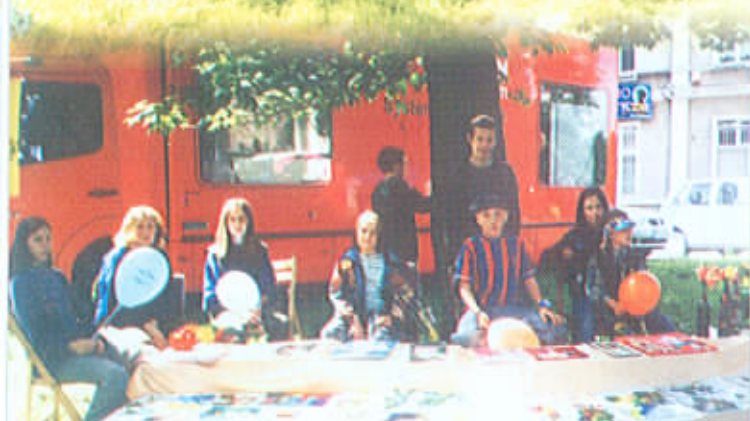
W czasie Dni Sulechowa dzieci ze świetlicy próbowały sprzedać to, co wcześniej z mozołem tworzyły.