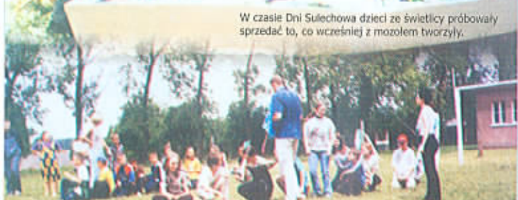
Podczas Festynu rywalizowały dzieci ze świetlic z Sulechowa, Kłępska i Cigacic.