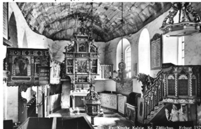
Il. 3 - Wnętrze kościoła w Kalsku - z lewej empora, w środku przed ołtarzem chrzcielnica, a po prawej ambona z baldachimem [7, s. 141]

Jezusa. Otoczona ona była herbami rodzowymi i napisem - „Nie ma żadnej większej pociechy na Ziemi niż częste oglądanie Męki Jezusa Chrystusa”. Po obu stronach znajdowały się wyobrażenia Zwiastowania Marii, Narodzenia Chrystusa, Ofiarowania świętyni i Zmartwychwstania. W skrzydłach ołtarza główne umieszczone były kolumny ozdobione pnącą się winoroślą z gronami. Kolumny podtrzymywały bogato zdobione zwieńczenie, w którego środku umieszczono Wniebowstąpienie. Szczyt zwieńczenia ozdobiono pelikanem, jako symbol ofiarnej miłości Chrystusa wierz ono, że ten ptak karmi swoje młode własną krwią [2, s. 25].