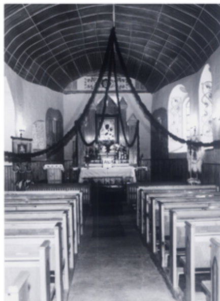
Il. 5 - Wnętrze kościoła po remoncie w 1976 r. [11]