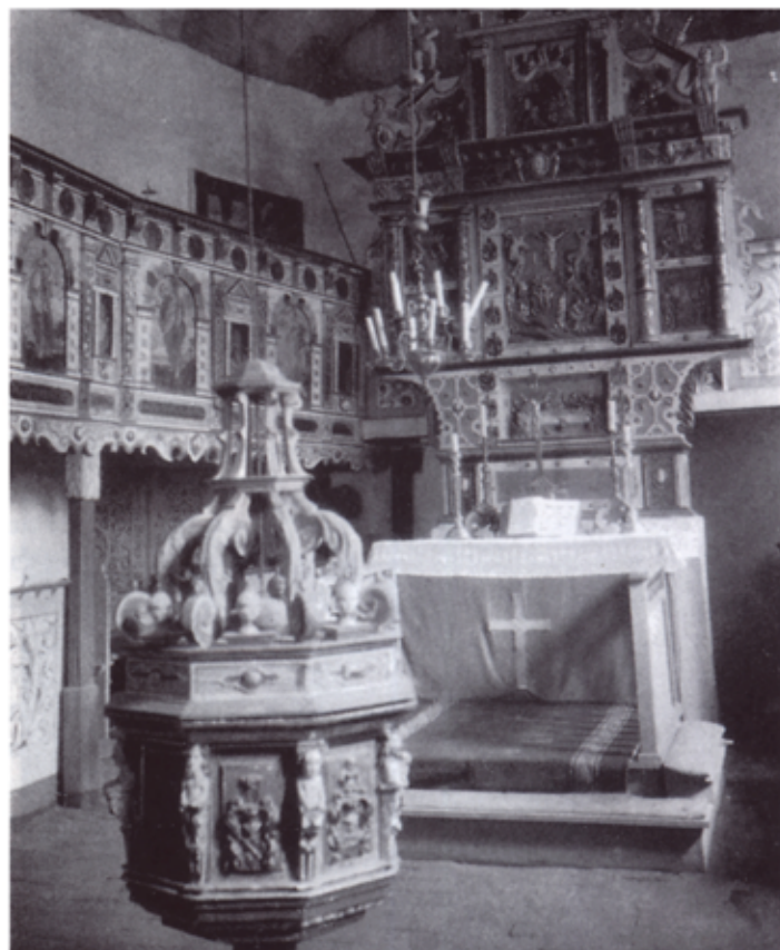
Il. 2 - Wnętrze kościoła w Kalsku z widokiem na ołtarz, na pierwszym planie chrzcielnica [6]

Jezusa. Otoczona ona była herbami rodzowymi i napisem - „Nie ma żadnej większej pociechy na Ziemi niż częste oglądanie Męki Jezusa Chrystusa”. Po obu stronach znajdowały się wyobrażenia Zwiastowania Marii, Narodzenia Chrystusa, Ofiarowania świętyni i Zmartwychwstania. W skrzydłach ołtarza główne umieszczone były kolumny ozdobione pnącą się winoroślą z gronami. Kolumny podtrzymywały bogato zdobione zwieńczenie, w którego środku umieszczono Wniebowstąpienie. Szczyt zwieńczenia ozdobiono pelikanem, jako symbol ofiarnej miłości Chrystusa wierz ono, że ten ptak karmi swoje młode własną krwią [2, s. 25].